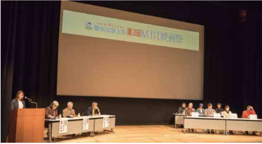
監督たちによるトークセッション