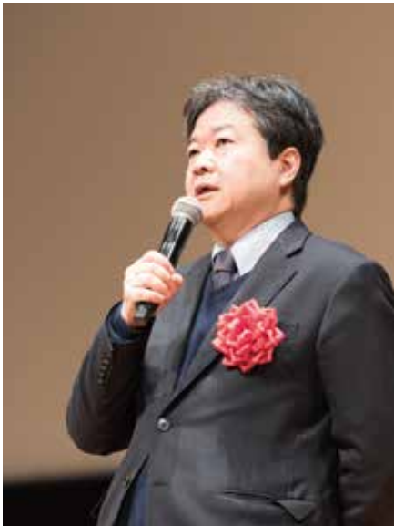
大島厚生労働事務次官のご挨拶

「難病」とは、一般的には治りにくい病気、治し方の分からない「不治の病」を指します。難病に指定されている病名は約300種類ありますが、日本での罹患者数は約100万人、人口の1%未満です。一方、が