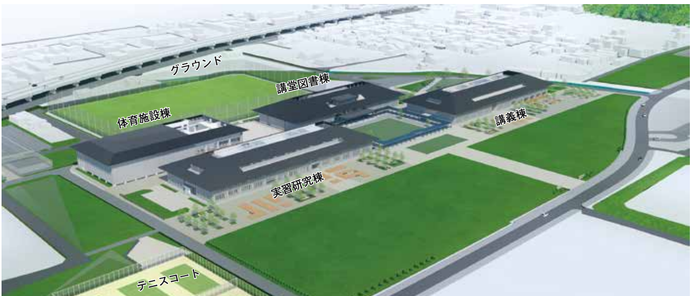
新キャンパスイメージ