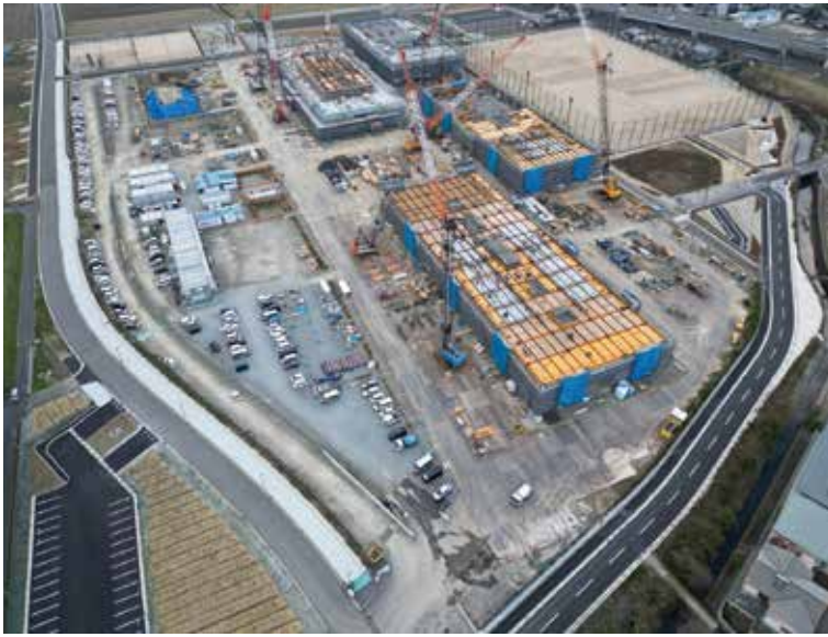
新キャンパス航空写真

また、敷地内に大雨の出水時に排水ピークを抑制する調整池をグラウンドの地下などに5箇所設けており、治水安全度を高めています。