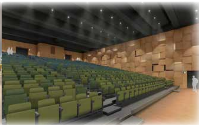
講堂図書棟 内観イメージ