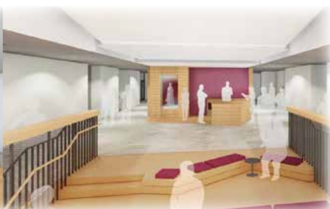
実習研究棟 内観イメージ