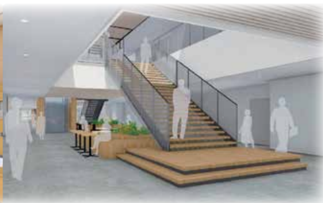
講義棟 内観イメージ