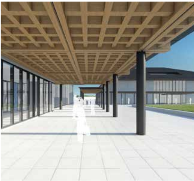
講堂図書棟 大庇イメージ

建物には、奈良の歴史的意匠をモチーフとした、木構造の大庇や勾配屋根など古都奈良に相応しい景観デザインを取り入れています。近隣の皆様や区域内を通行される皆様に対する安全を確保するとともに、騒音・振動に配慮し工事を進めて参ります。皆様のご理解とご協力をよろしくお願い申し上げます。