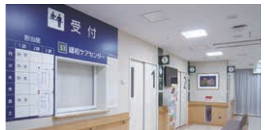
緩和ケアセンター