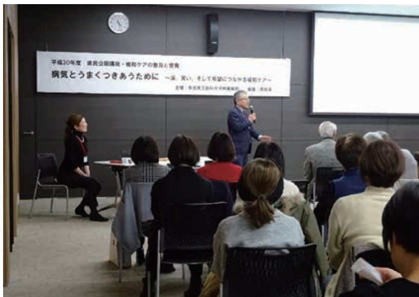
平成30年度 県民公開講座

療養中の患者さん・ご家族の方々、そして患者さんの周りでサポートしてくださっている方々、ぜひ緩和ケアのことを身近に感じて活用いただきたいと思います。私たちは、いつでも皆さんをお待ちしております。