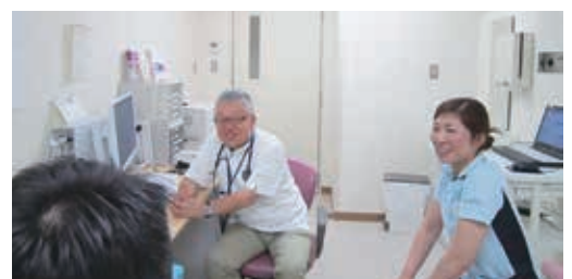
緩和ケア診察風景