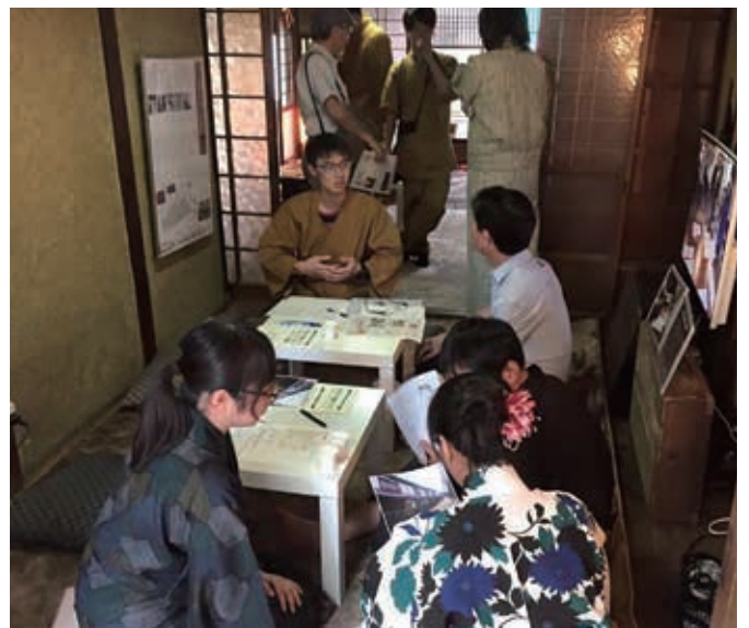
本学学生による健康相談

また今井町分室では、地元住民を対象に本学学生による健康相談、小中高生向けの学習進路相談会や、健康茶の試飲会といった様々なイベントを提供する活動空間としても活用しています。