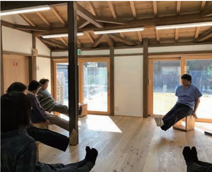
理学療法士による健康体操

今後も、MBTでは、「ひとつも元気に、まちなも元気に」をモットーとして、日々の健康習慣を意識できるプログラム等、医学の知識を最大限使って、地元還元していきます。