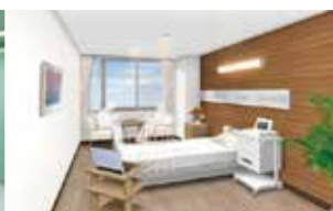
5F 母体胎児集中治療室