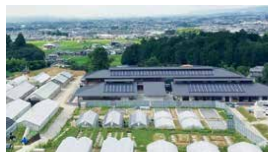
農業研究開発センター(移転後)

県農業試験場は、大正12年に橿原市四条町に開設され、平成12年に「農業技術センター」、平成18年に「農業総合センター」、平成26年に「農業研究開発センター」と組織改編を行いつつも、この間一貫して、奈良県唯一の農業技術に関する試験研究機関として、本県農業を支えてきました。