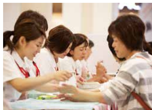
大人気のアロママッサージ

一方、企業ブースとして一般の方でも購入できる商品を展示いただきました。また、奈良県健康づくり推進課のご協力や同時にプレイベントとして開催している白檀生祭のブースも出店し、白檀生祭のゆるキャラであるッしようくとくた医師くんにも活躍してもらいました。