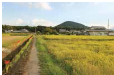
新キャンパス予定地