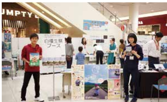
1階スターライトコート

健康長寿とは「日常歴に介護を必要とせず、健康で自立した生活ができる期間」のことです。本学が進めようとしている医学を基礎とするまちづくり(Medicine-based town:MBT)の基礎となるもので、運動・栄養・睡眠・口腔ケア・リラクゼーション・禁煙・社会参加などが重要と考えられています。健康長寿なまちづくりのためには、医療従事者、企業、そして地域住民の方と協力して取り組んでいく必要があります。そこで、10月10日(祝・月)にイオンモール橿原にて健康長寿(家族の健康を守る)を開催し、1階のスターライトコートと3階のスポーツオーソリティ前の2か所で実施しました。奈良医大からは約50名の教職員の参画の下、健康長寿を紹介するブースとして、メタボリックシンドロームブース、ロコモティブシンドロームブース、睡眠ブース、栄養ブース、痛みのブース、ストレス認知症ブース、アロマブース、アロママッサージブースを出しました。