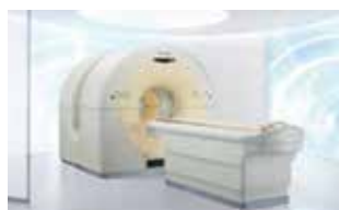
B1F PET-CT 室